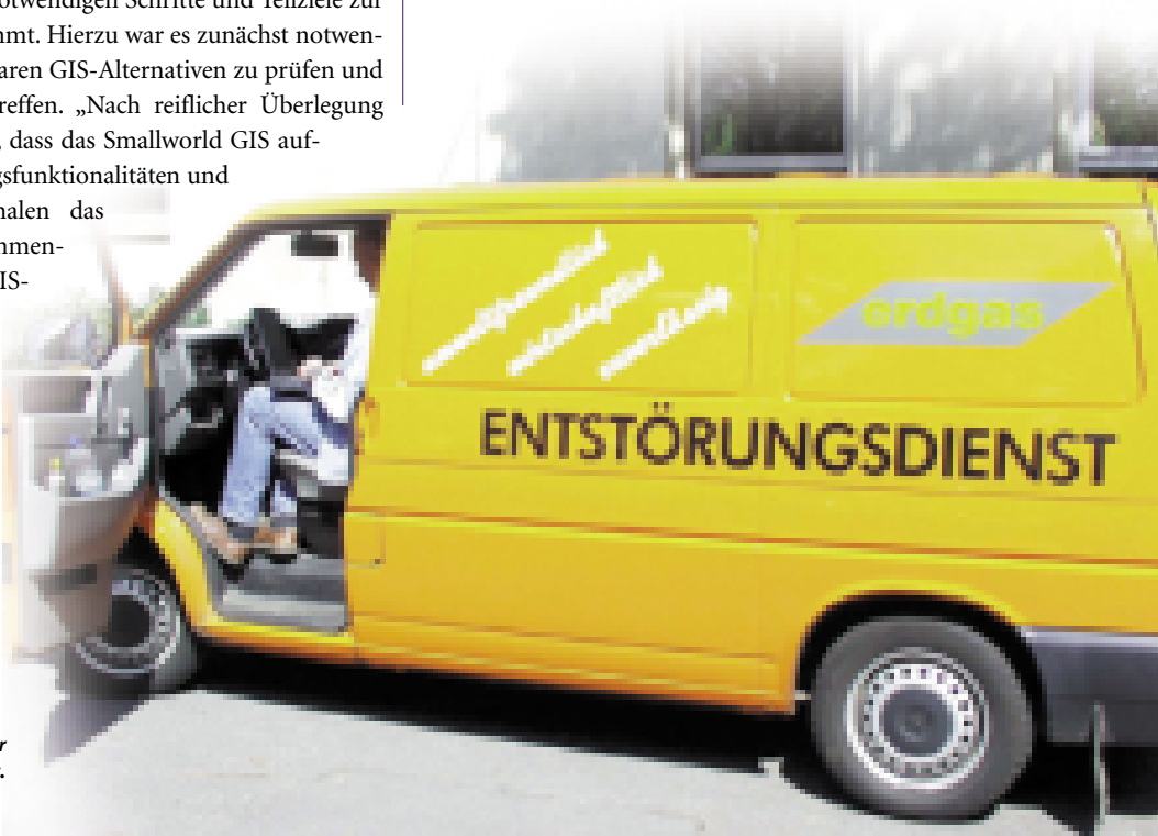
Der Störungsdienst Gas ist mit Laptops und der Mettenmeier Planauskunft ausgerüstet.

Nach einer Testdigitalisierung sowie Anpassungen des Daten- und Funktionsmodells wurde im Januar 1998 mit der Bestandsdatenerfassung Gas begonnen. Für dieses Projekt wurde die Mettenmeier GmbH aus Paderborn zusammen mit deren tschechischen Partnerunternehmen GSP aus Prag beauftragt. Die Abwicklung der Massendatenerfassung erfolgte in Prag, während die Verantwortung bezüglich der Termine, der Leistungserbringung und der Datenqualität beim Projektteam der Mettenmeier GmbH lag.